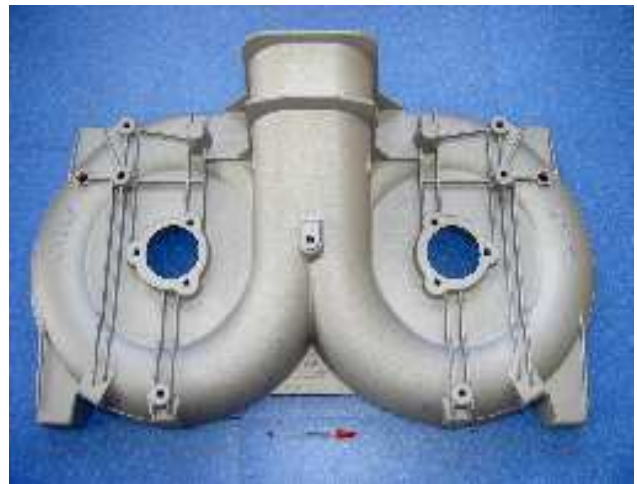
Carcasse de tondeuse double lame, réalisée en moulage sable sous vide, 18 kg