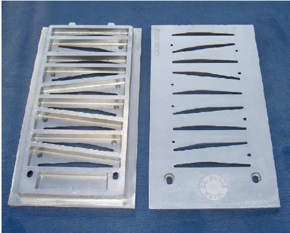
Grille de caniveau pour la ville de Reims, réalisée en moulage coquille 800x400 Poids 20 kg