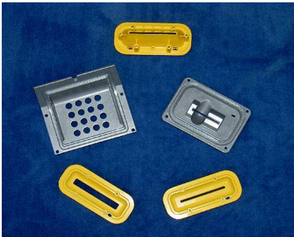
Pièces pour les distributeurs de tickets de transport