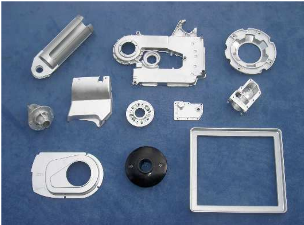
Quelques exemples de pièces sur une quantité d'environ 200 outillages différents, réalisées en moulage coquille