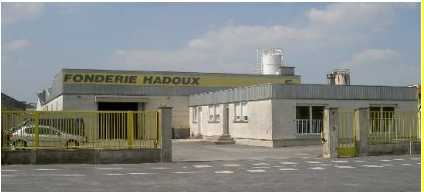
Division moulage coquille 7, rue Gutenberg