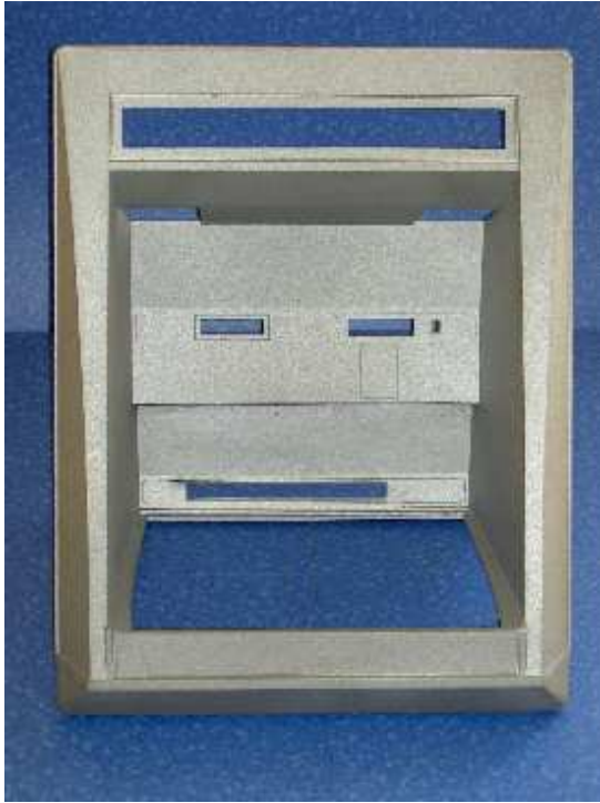
Distributeur de billets, réalisé en moulage sable sous-vide 550x500x400 Poids 11 kg