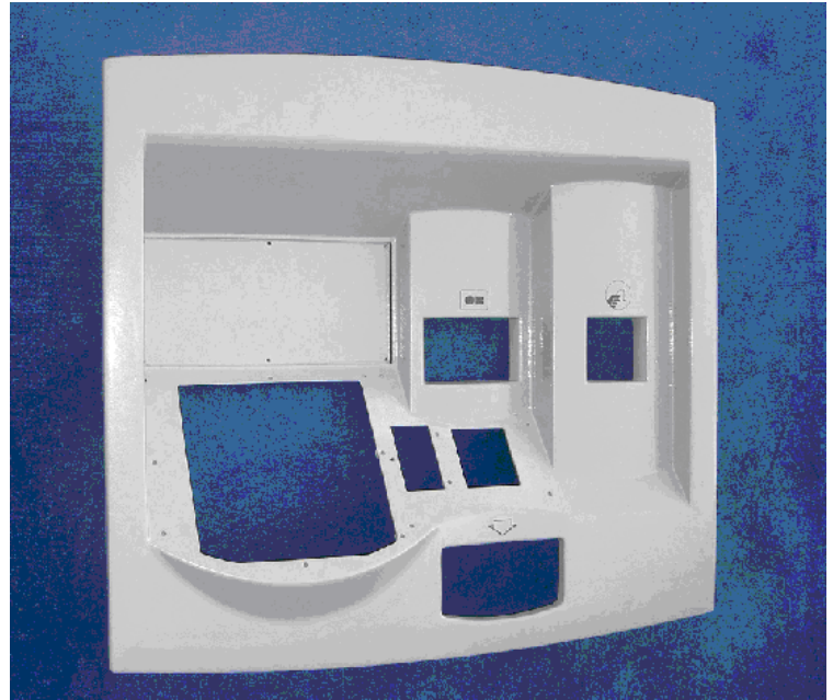
Pupitre pour distributeur de tickets de transport, réalisé en moulage sable sous vide 1000mm x 850mm Epaisseur 4