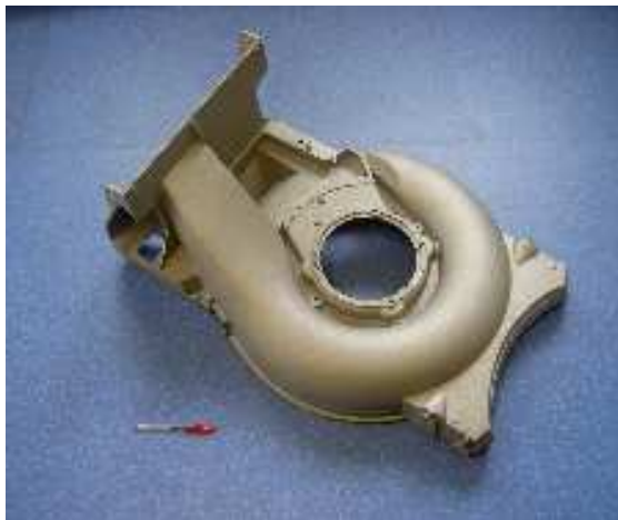
Carcasse de tondeuse simple lame, réalisée en moulage sable sous vide, 13 kg