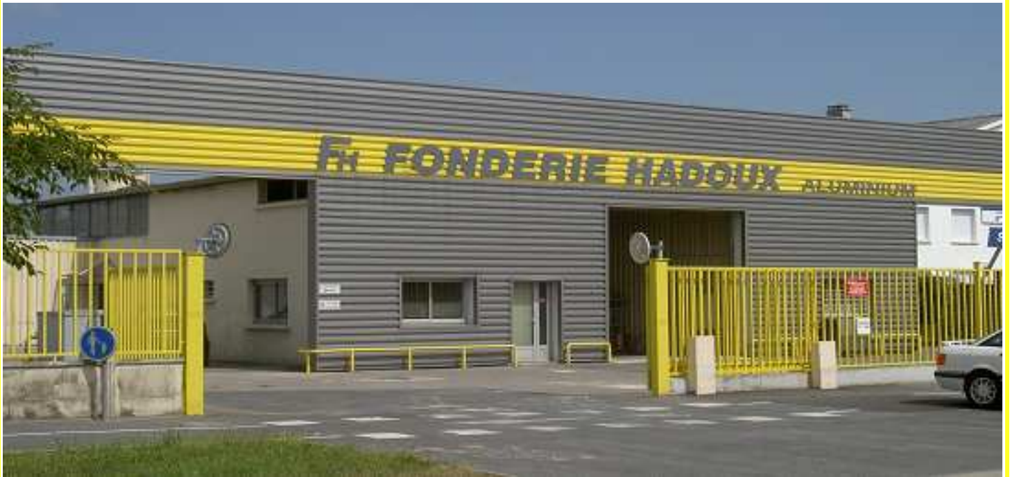
Division moulage sable Procédés de moulage sous vide et moulage chimique 9, rue Gutenberg